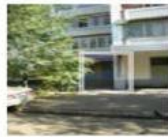
Рис. 4. Месторасположение парикмахерской

Собственнику желательно создать поток посетителей хотя бы 150 человек в неделю. Ассигнования, выделенные собственником на продвижение парикмахерской – не более 100 000 рублей. На той же улице четыре месяца назад открылась парикмахерская-конкурент на 4 посадочных места. Никаких услуг, кроме стрижки, не оказывают. Помещение крохотное, люди ждут своей очереди прямо в салоне. Работают 18-летние гастарбайтеры из Молдовы и Украины.